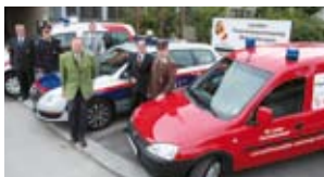
In OÖ fahren Rotes Kreuz, Polizei und Feuerwehr mit Erdgas.

Egal, ob privater PKW oder Firmenfahrzeug – der Umstieg auf ein Erdgas-Auto zahlt sich in jedem Fall aus.