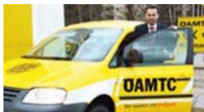
Der ÖAMTC ist mit Erdgas sicher unterwegs.